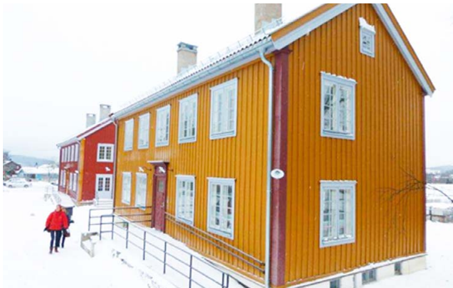
De nyoppussede kommunegårdene Grorudveien 3 og 5