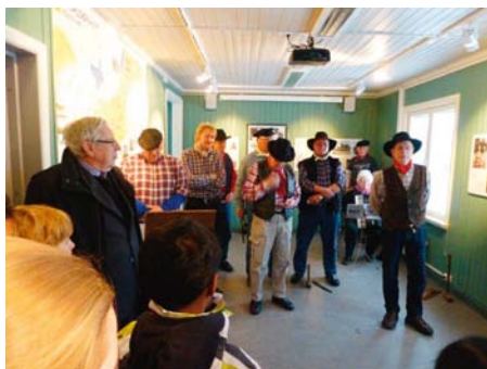
Groruddalen Arbeiderkor har tatt oppstilling og synger for de fremmøtte.

Det var nok flere enn meg som umiddelbart forsto at dette lokalet vil kunne egne seg utmerket til ulike intimkonserter.