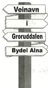
Forløperen til Prof. Birkelands vei ?

P.g.a. utbyggingen av E6 ble Strømsveien stengt på Furuset, og Sam Eydes vei ble anlagt som en tilførselsvei fra Prof. Birkelands vei til Karihaugveien (i dag Jerikoveien) som fortsatte over Granstangen bro (i dag Furuset senter) til Strømsveien høyere opp.