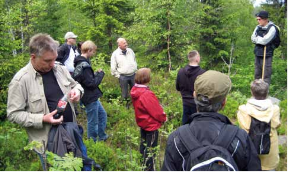
Gruppen samlet ved siste punkt på vandringen, alle lytter ivrig.

Underveis ble det fortalt om skålgropene ved Fossumberget, flere store og små gravrøyser, vei-vedlikehold på 1600-tallet, milorg hytta og Gjellerås Varden, før turen endte ved skansene som stoppet Karl XII og hans menn i 1716.