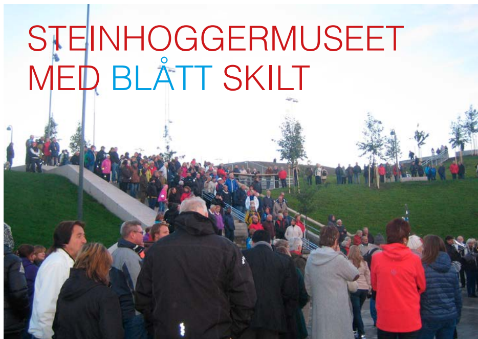
Offisiell åpning av Grorudparken.