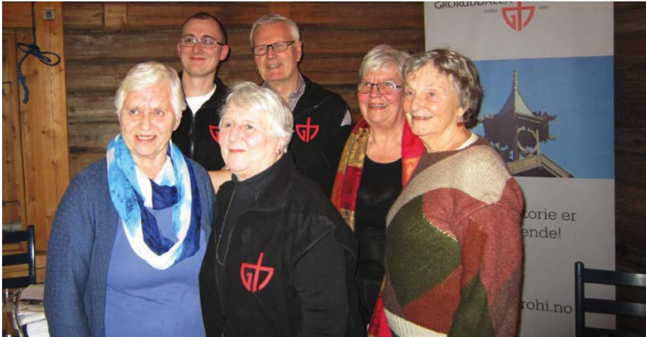
Deler av Historielagets nye styre for 2014.