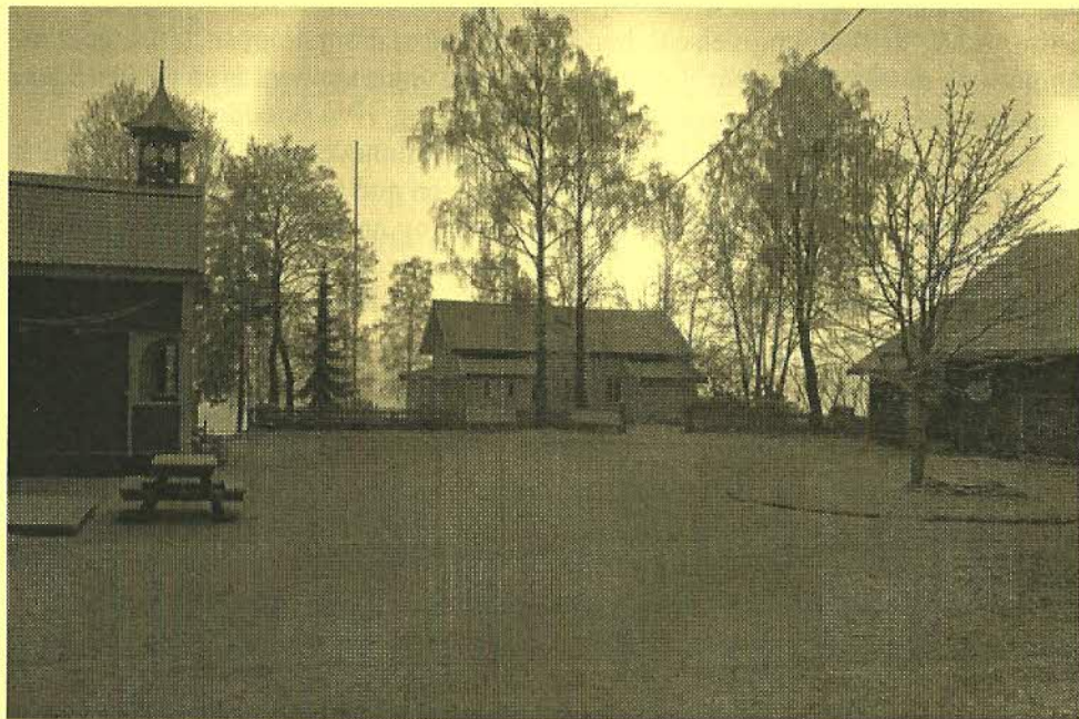
Vinterstemning på Nordtvet gård 2007