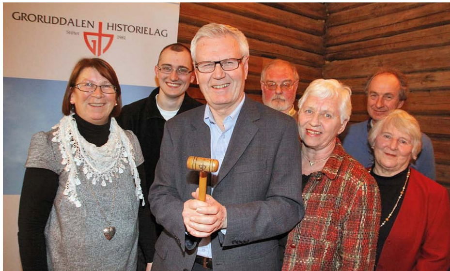
Her er noen av medlemmene i styret for 2012.

På årsmøtet 22. februar 2012 valgte Groruddalen historielag følgende styre: