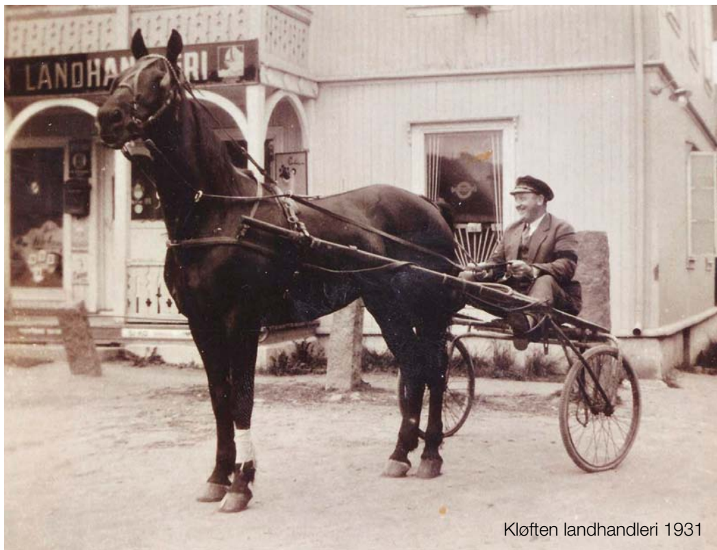
Kløften landhandleri 1931