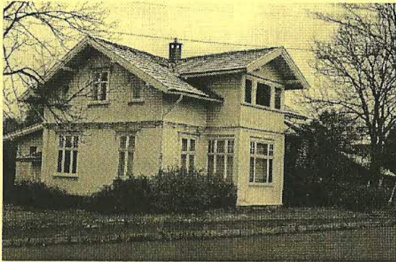
Kaggen gård 1992