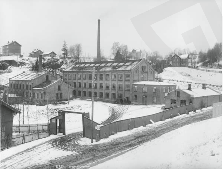
▲ Klesfabrikken fotografert av Anders Beers Wilse i 1926. Bestyrerboligen skimtes i bakgrunnen. Fotografiet finnes i Oslo Museums byhistoriske samling.

– litt lengre opp langs elven på Ammerud-siden. Det var vannkraften som gjorde beliggenheten attraktiv. Om lag 200 arbeidere var ansatt på fabrikkene.