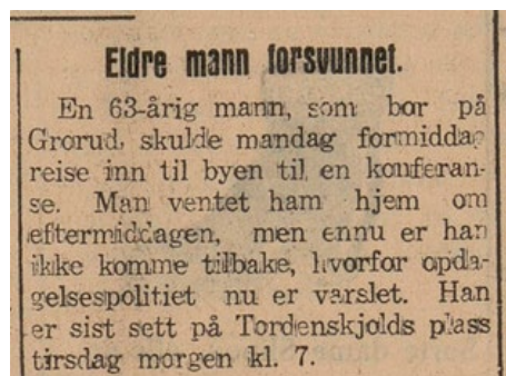
▲ Faksimile av Akershusposten 24. januar 1929.

I Akershusposten for torsdag 24. januar 1929 kan vi lese om en 63 år gammel mann fra Grorud som ikke hadde kommet hjem etter et møte i byen tre dager tidligere. Politiet ble koplet inn. Selv om mannen var sett i Oslo sentrum dagen etter at han forsvant, fant heller ikke Oslo Opdagelsespoliti ham.