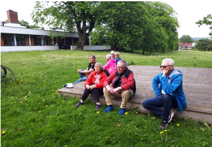
◀ Gamlehjemmet på Økern.