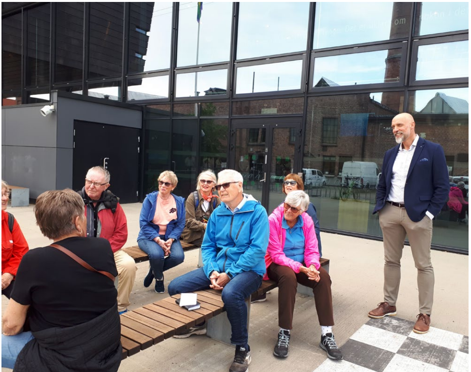
▲ Kuben yrkesarena.