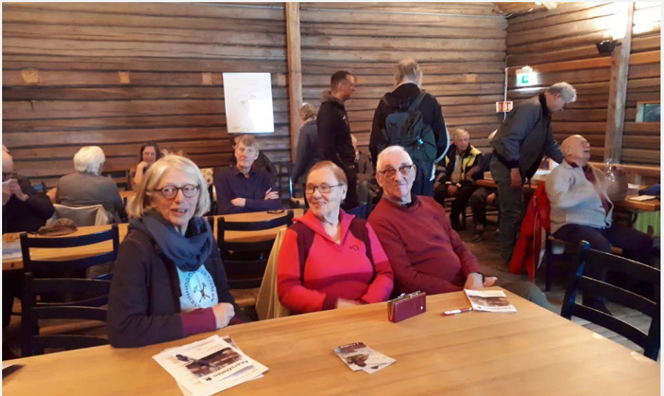
▲ Mange publikum tilstede.