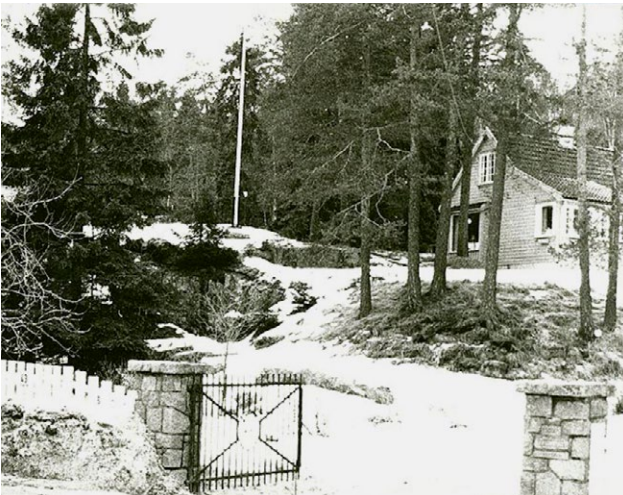
◀ Frankrig – Bergensveien 41. Bildet finnes i Groruddalen historielags billedatabase.

Huset var bygget av laftet tømmer i halvannen etasje og panelt. Det var full kjeller.