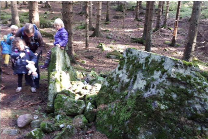
◀ Gamle gravrøyser.