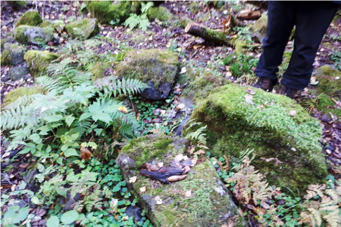
◀ Gamle fornminner nesten gjengrodd.