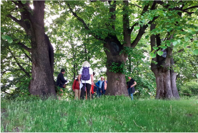
◀ Gravhaugene på Økern.

Vi gikk opp en alle mot der hvor gamle Økern hovedgård har ligget. Der ligger tre gravhauger fra eldre jernalder 500 f.kr – 400 e.kr. Selv om de ikke er veldig store, har de nok tilhørt viktige personer. Gravene er fredet men ikke undersøkt.