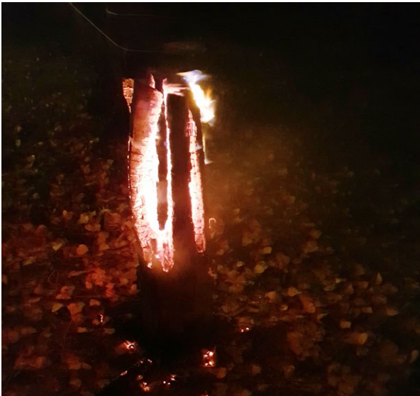
◀ Haralds spesialfakkel av en tørr trestamme skapte stemning i den mørke oktoberkvelden.