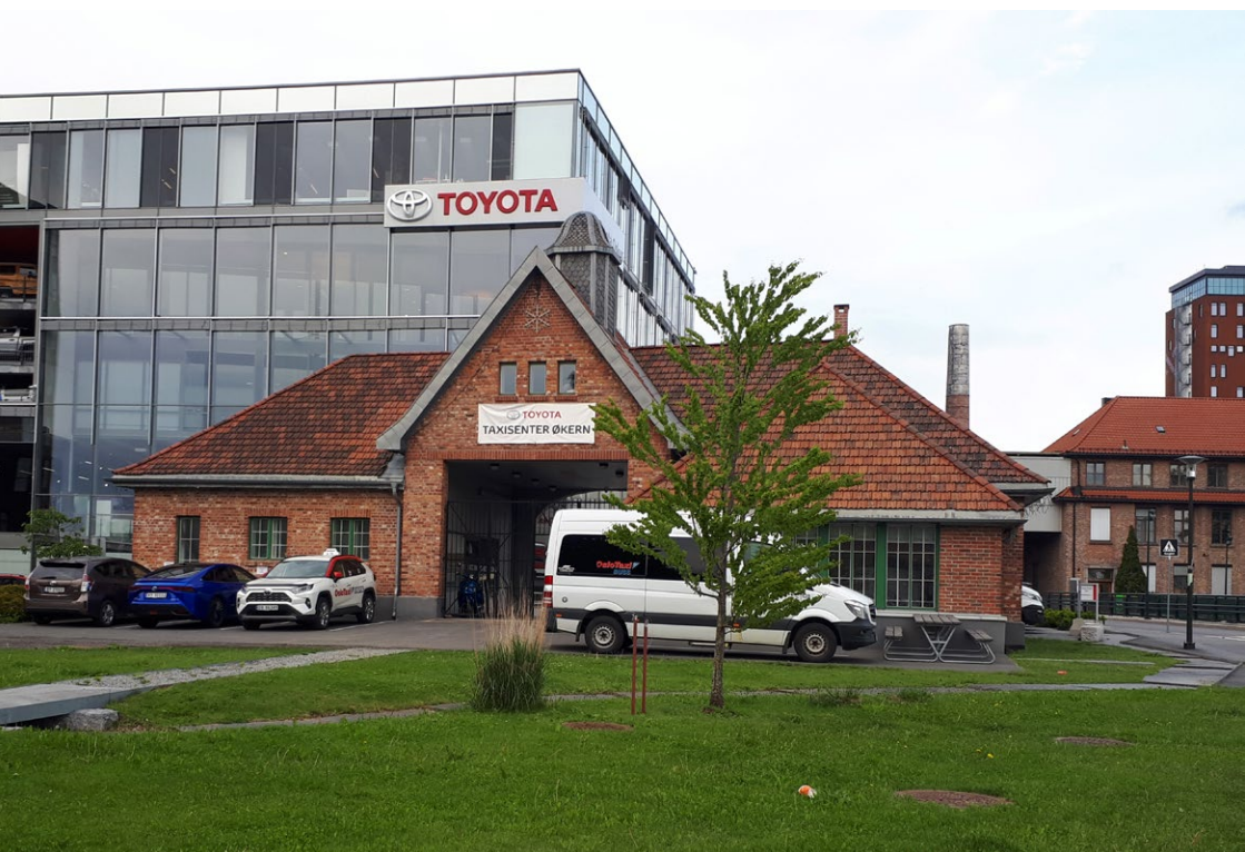
▲ Portbygningen til Kabelfabrikken.

Nordre Hovin to hus fra slutten av 1700-tallet. Regulert til bevaring.