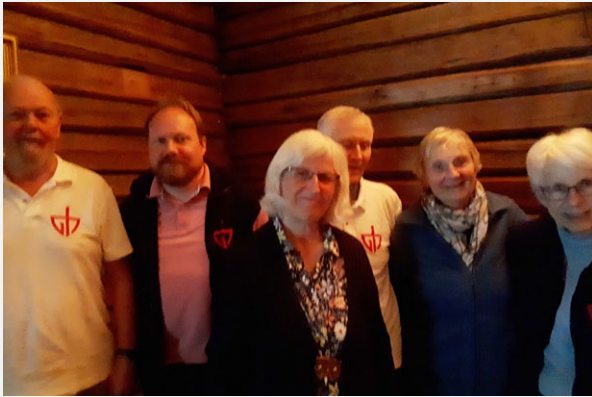
◀ Deler av styret.